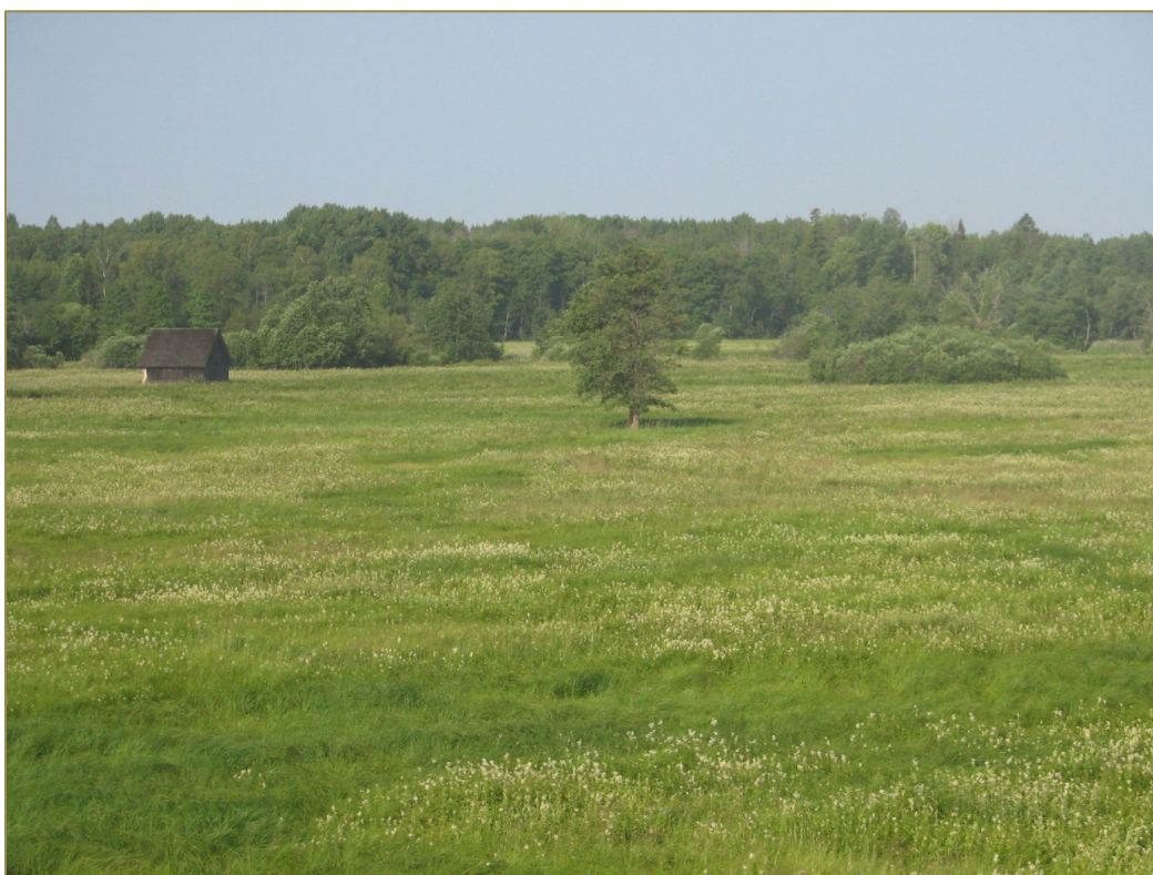
Õitsev luht Soomaa rahvuspargis