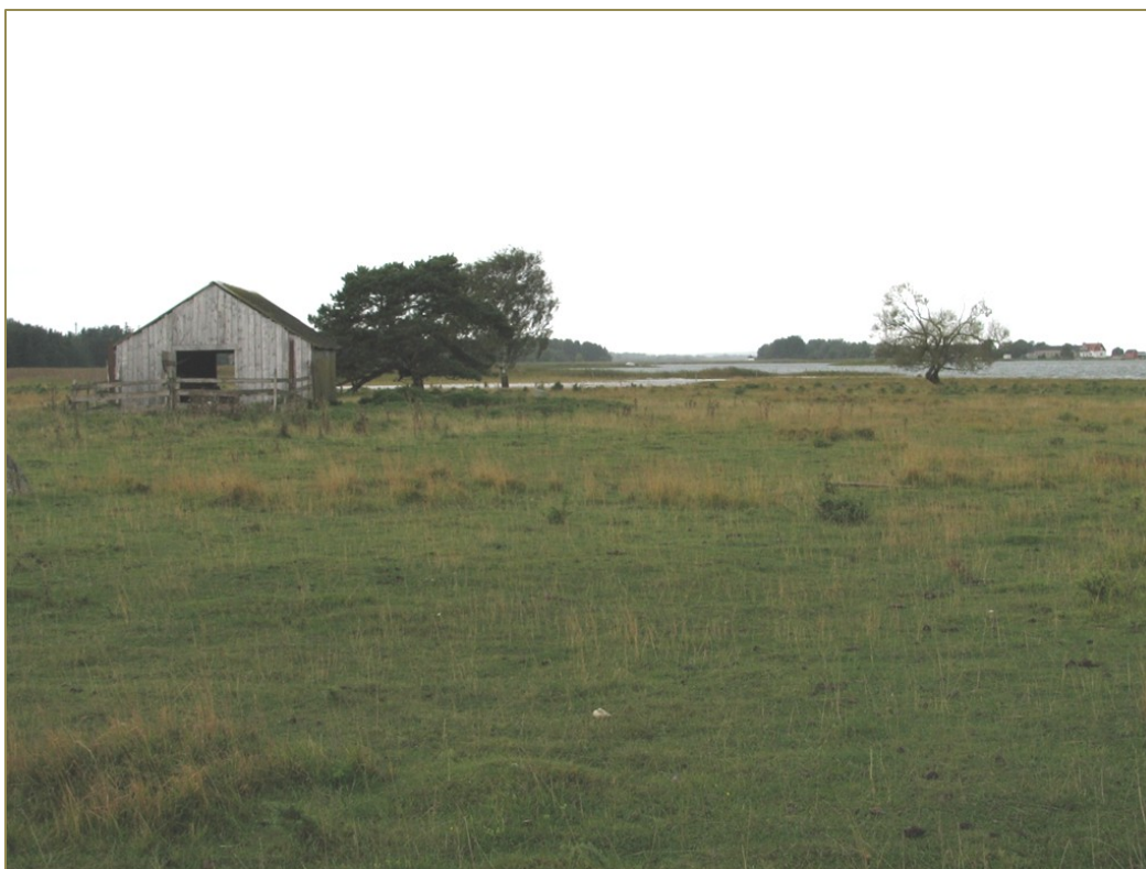
Karjatatud rannaniit Saaremaal