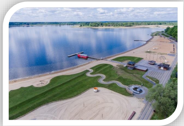
Tamula järve rand.

Kas supelrand on sama mis supluskoht? Miks on vajalik üldplaneeringus määrata supelranna ala? Millised kohustused KOV-ile kaasnevad üldplaneeringus supelranna ala määramisega? Terviseameti põhimõtted ja varasem praktika.